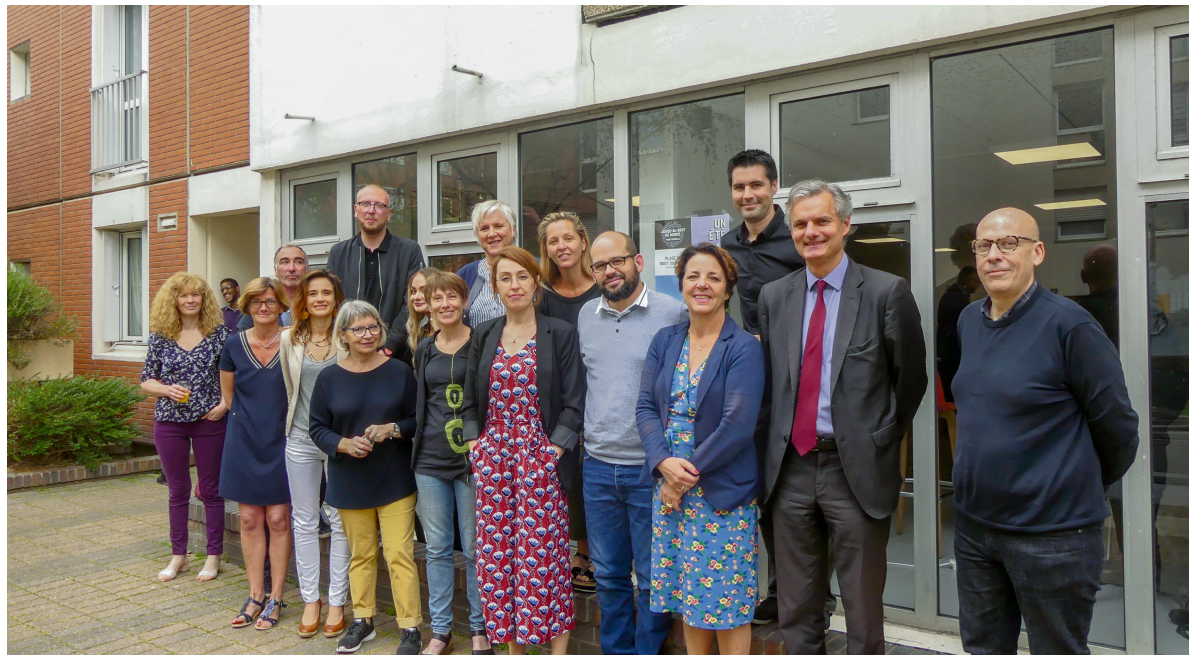
Les nouveaux locaux rue Pierre-Faure ont été inaugurés vendredi 31 mai.

Né avec Un été au Havre, Mémediation a su développer son activité depuis deux ans. Elle accompagne des salariés qui cherchent un emploi. En parallèle, ils travaillent sur des événements culturels locaux grâce à Un